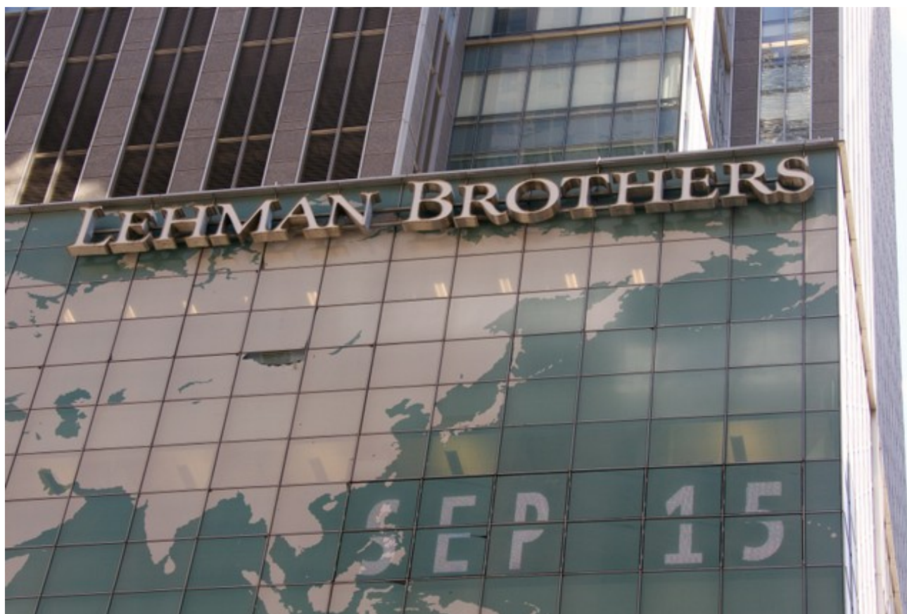
Lehman Brothers gick i konkurs den 15 september 2008.

Omvärldens förtroende var totalt förbrukat.